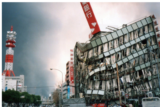
阪神・淡路大震災の被災状況

棟、ライフラインの被災(電気約100万戸停電・水道約127万戸断水・ガス約84万戸供給停止・電話約28万回線不通)、交通の遮断(鉄道 神戸阪神間全線不通・高速道路 阪神高速道路等18路線全線不通・県管理道路 38箇所規制)という大惨事でした。