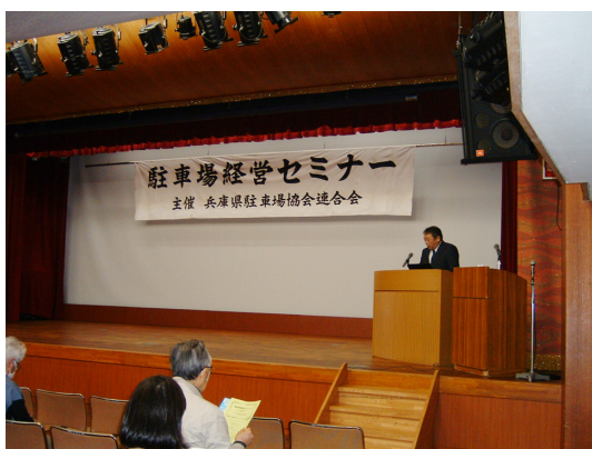
駐車場経営セミナーの状況

最近では、令和5(2023)年度「特殊詐欺に騙されないために、安全歩行・安全運転のススメ(県警)」、令和4(2022)年度「インボイス制度への対応(税務署員)」、令和3(2021)年度「駐車場経営者さんの判断能力があやうくなられたら…(公認会計士・税理士)」など、会員様への情報提供としてセミナーを開催しています。