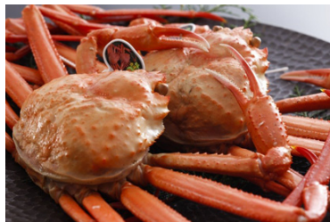
香住ガニ