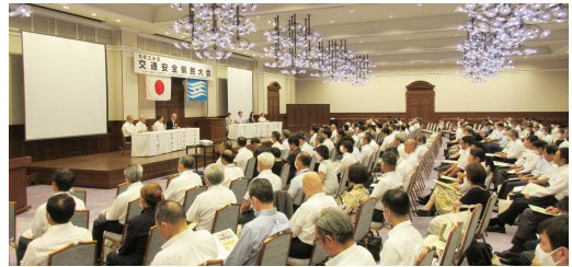
令和5年度交通安全県民大会の状況

兵庫県等が開催する交通安全県民大会等へのイベントに参加するなど、県民に対する交通事故防止のための啓蒙活動を推進しています。