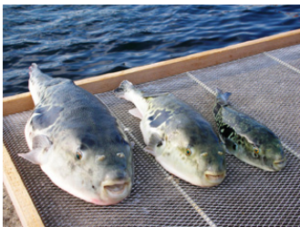
淡路島3年とらふぐ

明石海峡や紀淡海峡の非常に流れの速い海域で漁獲され、鮮やかな桜色にブルーの斑点の輝きは養殖物とは一目で違いがわかります。刺身、塩焼き、蒸し焼きなどで食べてもたまりません。