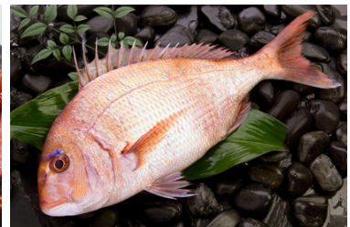
明石桜鯛